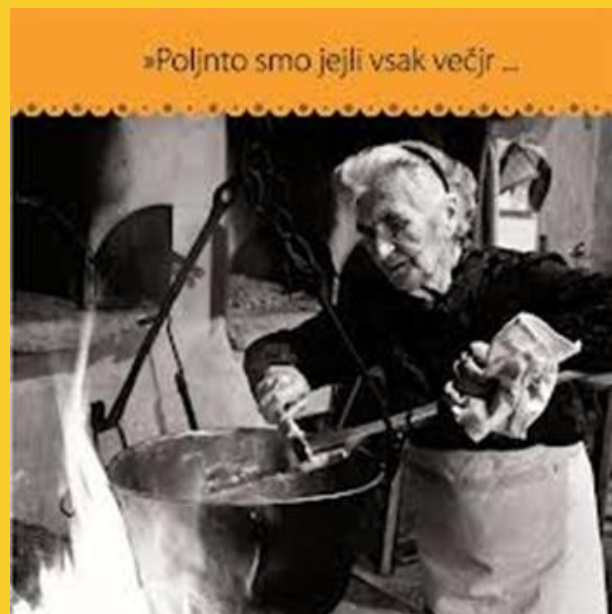
Kuhanje polente na ognjišču.

V mlinu je mlinar koruzna zrnja zmel. Če jih je zmel bolj na grobo, je nastal gres za kuhanje polente. Če jih je zmel bolj na drobno, pa je nastala moka za koruzen kruh.