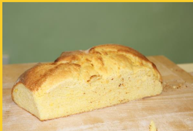
Koruzen kruh.