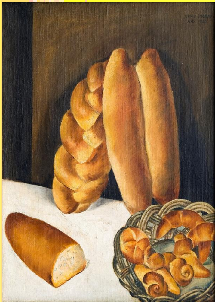
Veno Pilon, Kruh, 1922, olje, platno, last: Pilonova galerija Ajdovščina.

Morda pa polžku pomagamo tako, da mu skupaj s starši spečemo slastne pekarske dobrote: ptičke, polžke, rogljičke, ali žemljice.