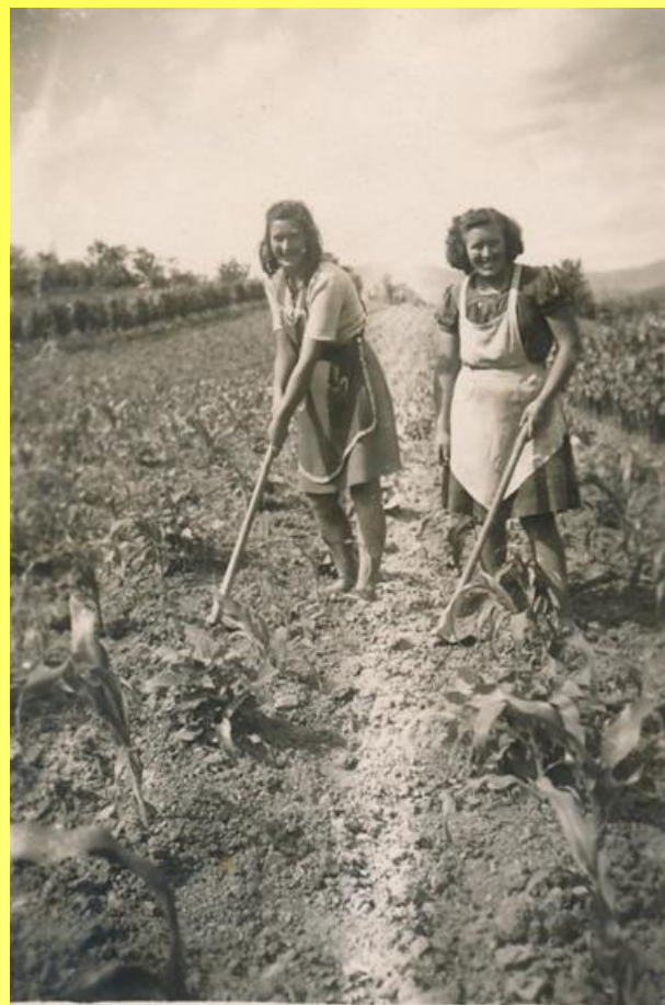
Pletje koruze v Podragi leta 1955.