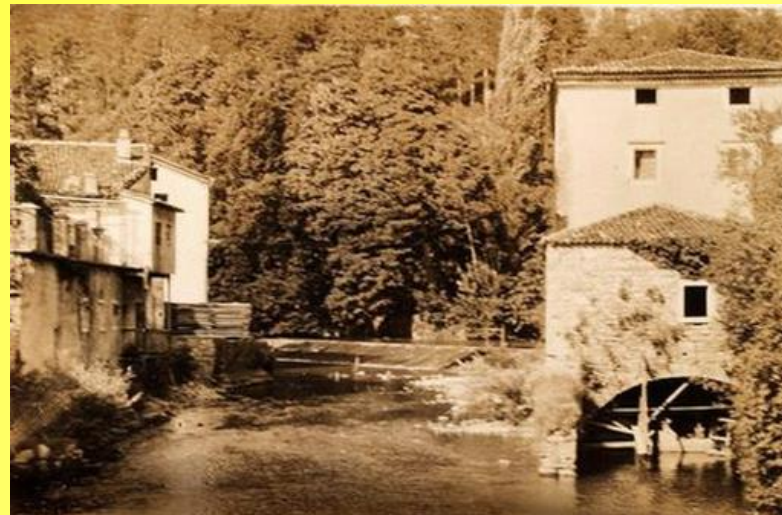
Nekdanja žaga in mlin ob izviru reke Vipave – Podskala, leta 1926.

Vir: Slovenski etnografski muzej, Digitalne zbirke, Veno Pilon. Foto: Veno Pilon, 1926.