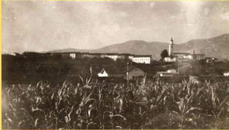
Polje koruze pred vasjo Prvačina, leta 1926.